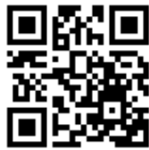
申請表單 QR CODE

應於公告日至活動期間於 https://reurl.cc/A455yK 填具申請資料，待本府節電夥伴推動小組資格審查後發送核定單即完成申請。申請完成後依核定日起至 30 日內完成清洗，並依規定繳交指定資料，完成核銷作業。